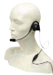
MDPMLN4444 — Гарнитура MAG ONE с мягкими ободами и встроенными переключателями PTT/VOX