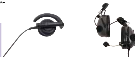
BDN6720 — Головной телефон с жесткими ободами

Ключевая сфера в быстро меняющемся и непредсказуемом мире — это обеспечение общественной безопасности. Надежная оперативная радиосвязь является жизненно важным фактором