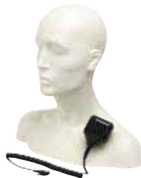
HMN9030 – Выносной микрофон с динамиком