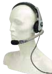
RLN5238 — Гарнитура Stadium среднего веса с тангентой