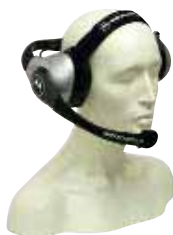
RMN5015 – Сверхпрочная гарнитура (требует кабеля–адаптера гарнитуры RKN4090)