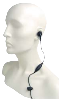
MDPMLN4442 Наушник с микрофоном на шнуре