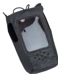
PMLN4467 Чехол из мягкой кожи