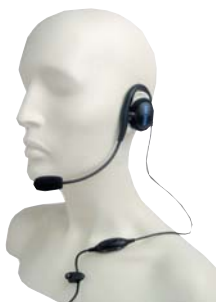
MDPMLN4444 Наушник с выносным микрофоном