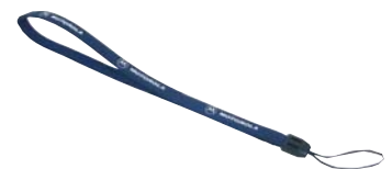
JMZN4020 Ремень для ношения на запястье