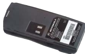
PMNN4046 NiMH Аккумулятор