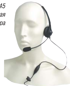
MDPMLN4445 Сверхлегкая гарнитура