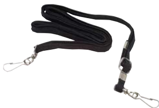
4285820Z01 Ремень для ношения на плече

Радиостанции Серии Alfa – это качество, надежность, долговечность.