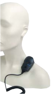
N4008 он/Динамик RSM

Радиостанции Серии Alfa разработаны для обеспечения эффективной организации работ, помогают на месте скоординировать развертывание оборудования и расстановку персонала, обеспечивают моментальный доступ по радио к сотрудникам, повышают безопасность в зоне проведения работ, снижают риски возникновения несчастных случаев, позволяют передавать срочные сообщения сразу всему коллективу.