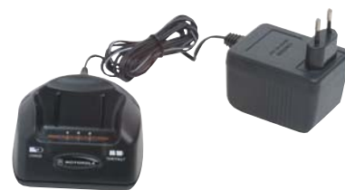
MDPMTN4049 Быстрый зарядник (Евро-вилка)