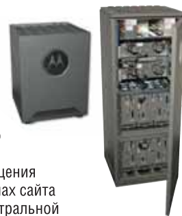
Базовые станции MTS 2 и MTS 4 стандарта TETRA

- Базовые станции Dimetra обладают интеллектуальными возможностями локального транкинга, позволяющими сохранять возможность общения между абонентами в пределах сайта в случае потери связи с центральной инфраструктурой. Кроме того, базовые станции поддерживают резервирование приемопередающей аппаратуры базовых станций и контроллеров сайтов. Чувствительность приемников базовых станций Motorola нового поколения как минимум на 7 дБ лучше, чем у обычных базовых станций стандарта TETRA. Поэтому с их помощью можно добиться значительного расширения зоны действия сетей без ущерба качеству обслуживания.