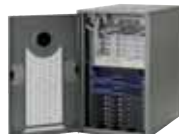
Scalable Dimetra IP

Программные средства Scalable Dimetra IP, которые мы используем в поставляемых нами системах, стабильно обеспечивают очень быстрое установление группового вызова даже между абонентами, находящимися в различных зонах.