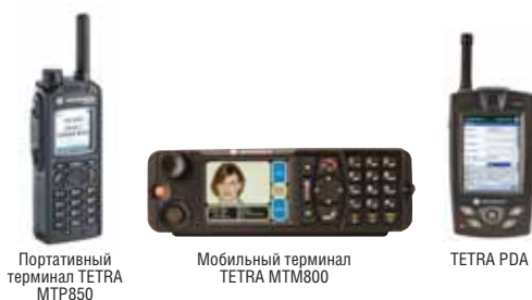
Портативный терминал TETRA MTP850

Портфель Абонентских устройств Motorola TETRA позволяет каждому пользователю выбрать оптимальные средства, наилучшим образом подходящие для решения стоящих перед ним профессиональных задач. При выборе пользователями принимаются во внимание такие факторы, как долговечность, эргономические качества, связь с абонентскими группами и многие другие.