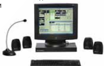
Диспетчерский пульт MCC7500

При помощи виртуальных ведомственных сетей организации могут осуществлять коллективное пользование ресурсами сети с необходимым им уровнем безопасности и управления, и при этом не тратить средств на создание отдельных инфраструктур. Коллективное пользование сетями позволяет организациям