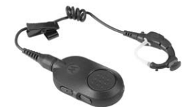
Беспроводной наушник Operations Critical

«Когда я впервые увидел радиостанцию MOTOTRBO серии SL, я подумал, что это мобильный телефон, а не радиостанция двусторонней радиосвязи. Она обладает всеми функциями радиостанции двусторонней радиосвязи, и по своему внешнему виду предназначена для профессиональных целей. Она прекрасно подходит для всех видов нашей форменной одежды».