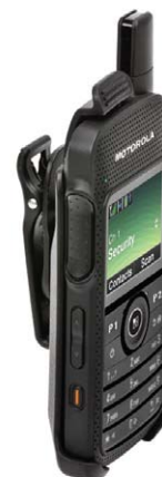
Крепление для переноски радиостанции

Наше многоместное зарядное устройство настолько мощное, что оно позволяет одновременно заряжать 6 радиостанций или батарей. Это устройство отличается высокой функциональностью и небольшими размерами.